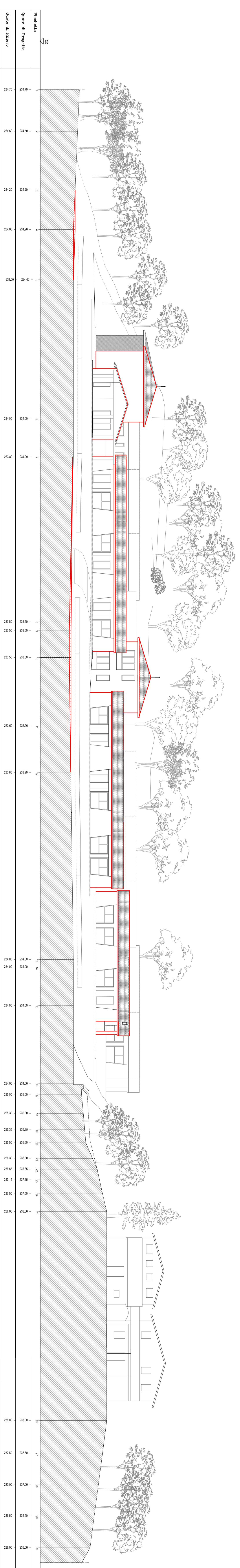
PROFILO I - I