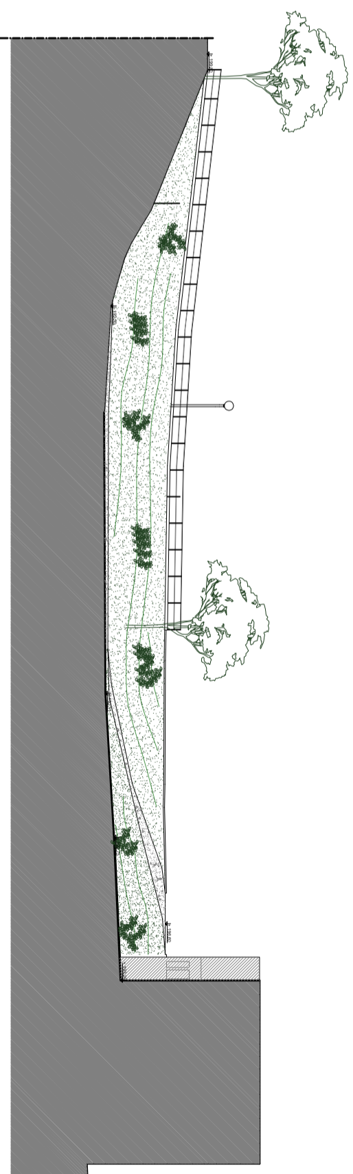
PROFILO A - A

IL FUNZIONARIO DEL SERVIZIO ASSETTO DEL TERRITORIO :