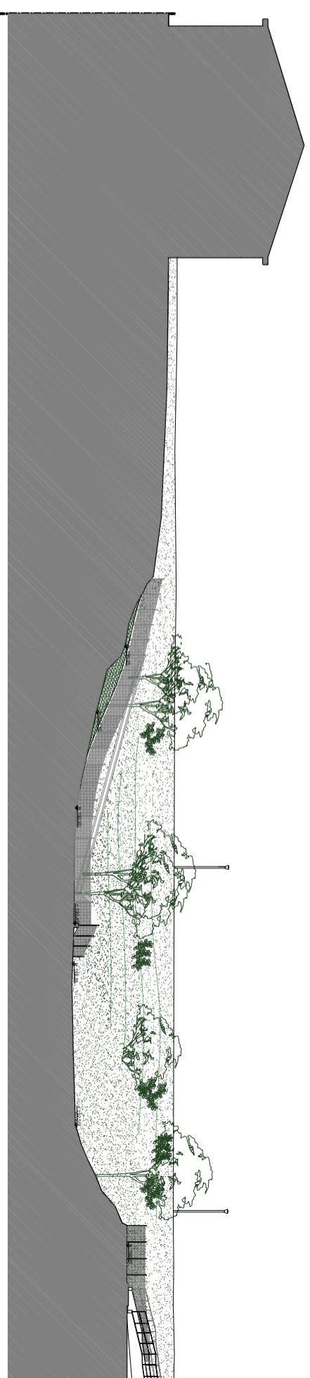
PROFILO C - C