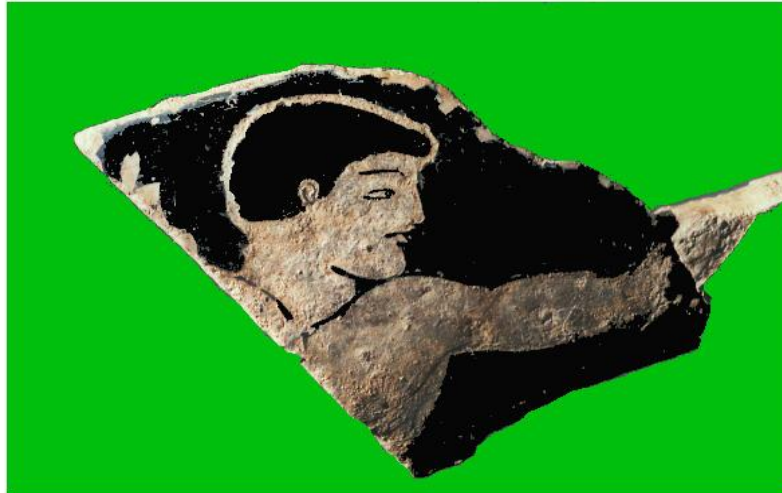
FRAMMENTO DI VASO ATTICO A FIGURE ROSSE CON SCENE DI ATLETI