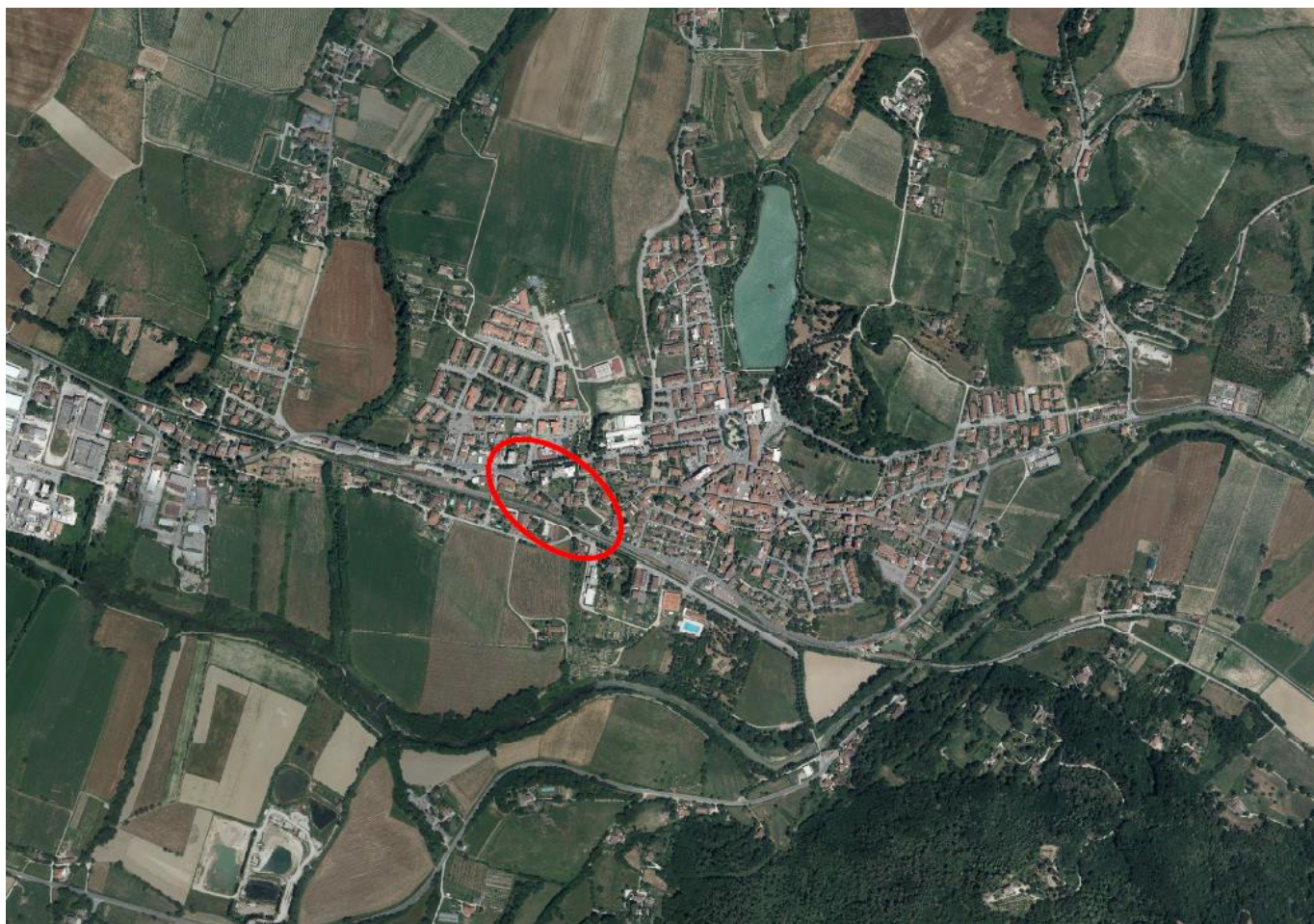
FIGURA 1 - Ortofoto con individuazione della zona di intervento

L'area interessata dall'intervento si trova nel settore Ovest del centro abitato del Comune di Vicchio.