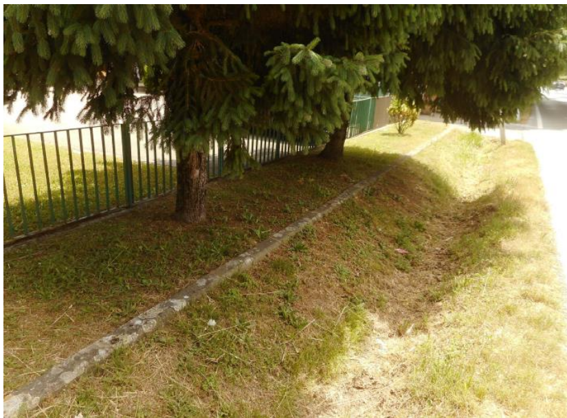
FIGURA 4 - Vista dell'aiuola inerbita privata presente sul margine sinistro del tratto oggetto di intervento, subito a fianco della cunetta esistente, in direzione Sud-Est