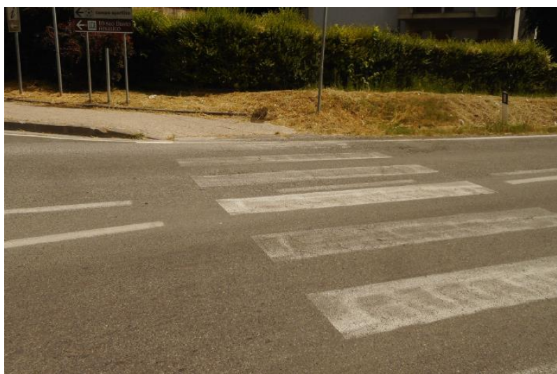
FIGURA 2 - Vista dell'attraversamento pedonale nei pressi dell'intersezione tra la SP 551 e Viale Beato Angelico