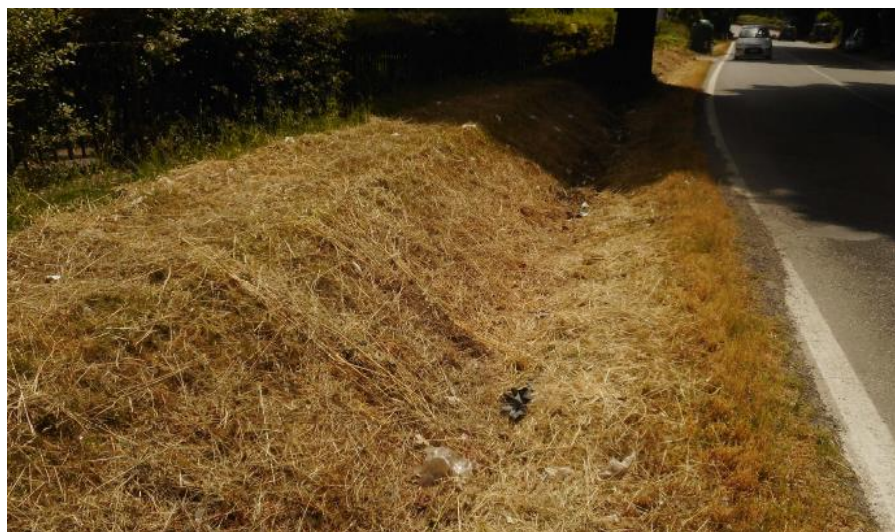
FIGURA 3 – Vista della cunetta esistente sul margine sinistro della SP551 tra Viale Beato Angelico e via G. Carducci