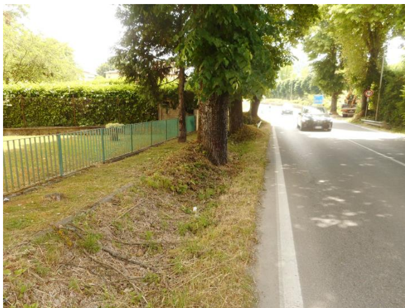
FIGURA 5 - Vista del margine sinistro del tratto oggetto di intervento e delle alberature presenti, in direzione Sud-Est

Le aree oggetto degli interventi ricadono quasi esclusivamente su AREE DEMANIALI, tranne per alcuni brevi tratti.